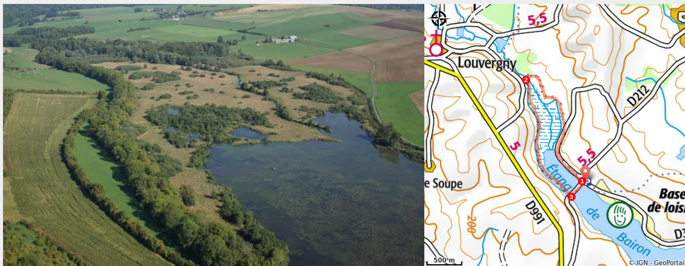
Vieil étang de Bairon (2c2a)

Le tour du Viel-Étang de Bairon, un site de 105 hectares classé Natura 2000 très prisé des oiseaux.