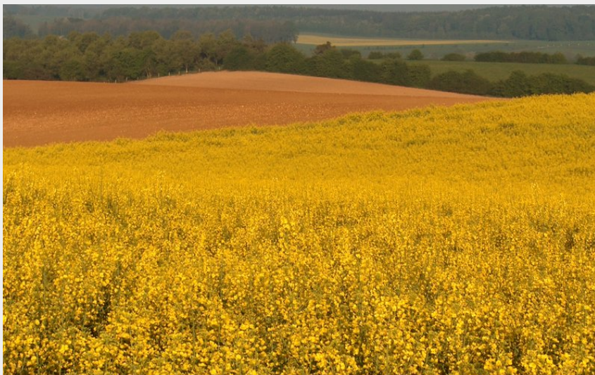
Panorama Vouzinois (Sophie BETTIG)