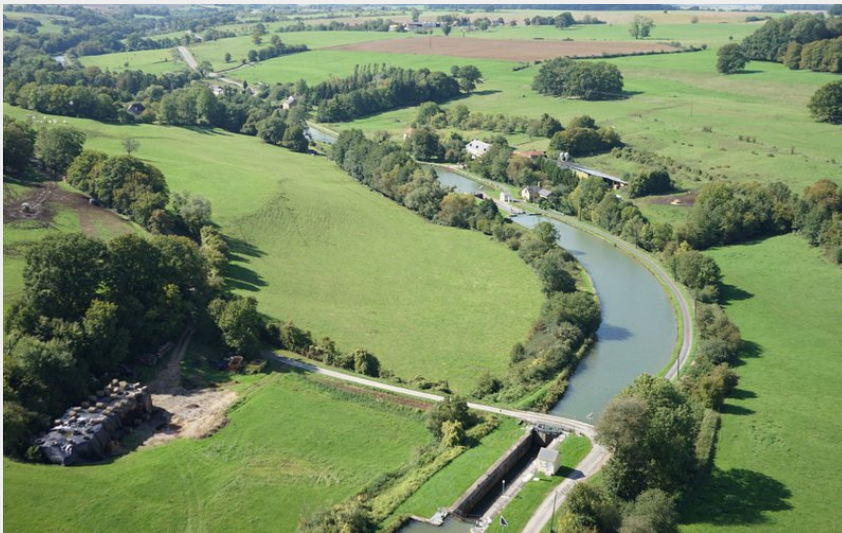
Vallée des écluses (Action Drones)