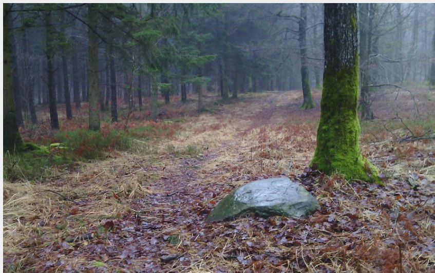
Pierre des Templiers