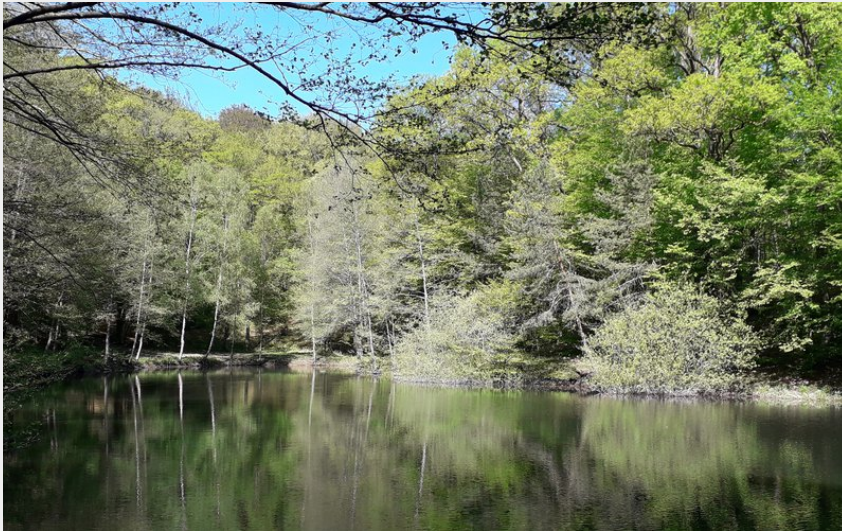
Etang de la Demoiselle