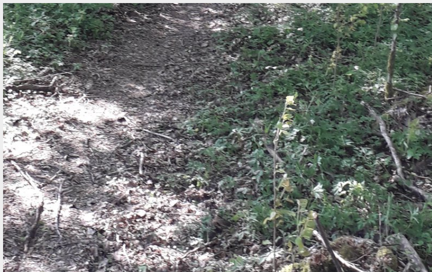
Sentier forestier