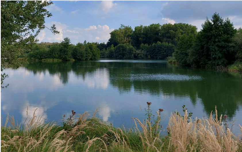
Etangs de la Bar