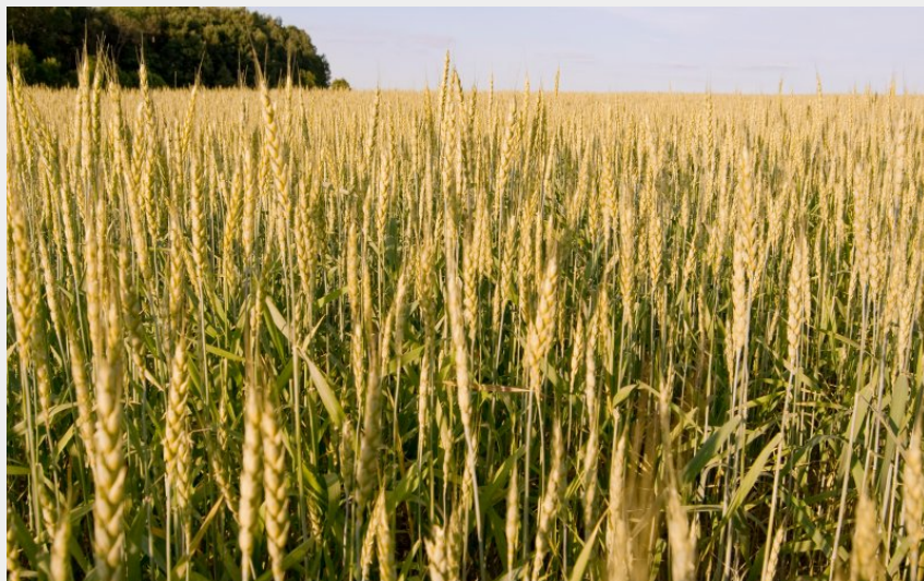
champ de blé (libre de droit)