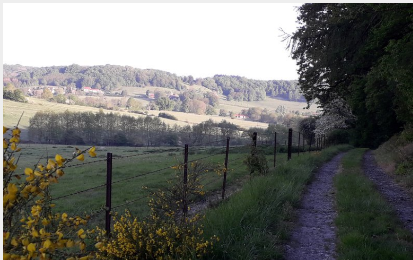
chemin caunoy (chemin caunoy)