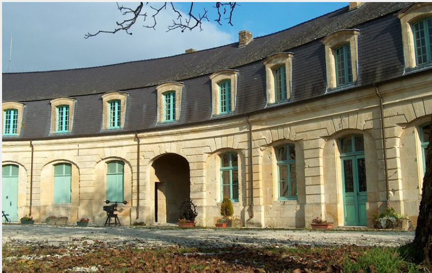
Commun du château Augeard (Sophie Bettig)