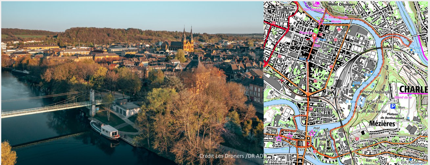
Charleville-Mézières en Ardenne - Les Droners (Les Droners)

Découvrez l'histoire mêlée des ces deux villes si différentes : Mézières, médiévale, commerçante puis ville de défense du Royaume de France et Charleville, ville née du rêve d'un Prince italien.