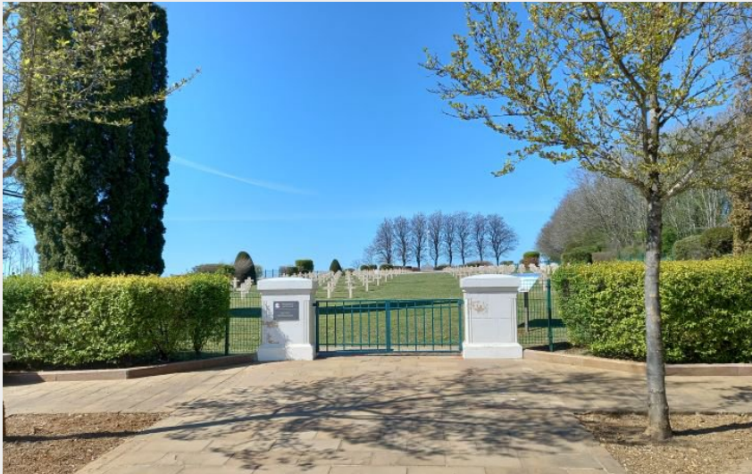
la marfée (ardenne metropole)