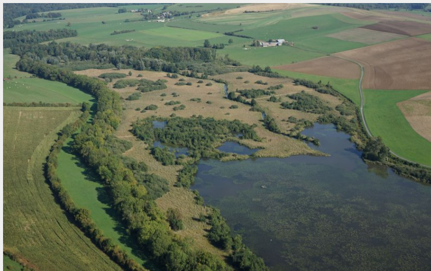
le lac de bairon (2c2a action drone)