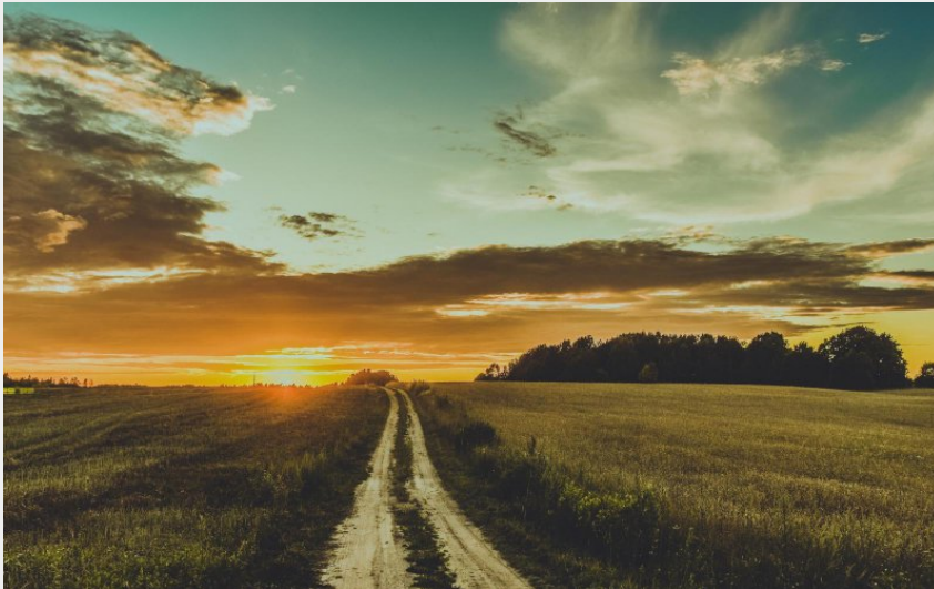
coucher de soleil chemin rural (libre de droit)