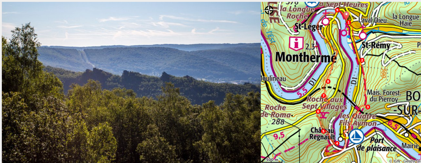
les 4 fils aymon bogny sur meuse (Laetis - visitardenne)

Bienvenue en forêt profonde : Arduenn Sylva, futaies de chênes et de hêtres dans les creux où l'argile s'est accumulée, maigres taillis sur les pentes où le roc est à nu.