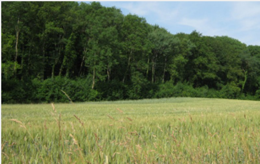
Prairie de Singly