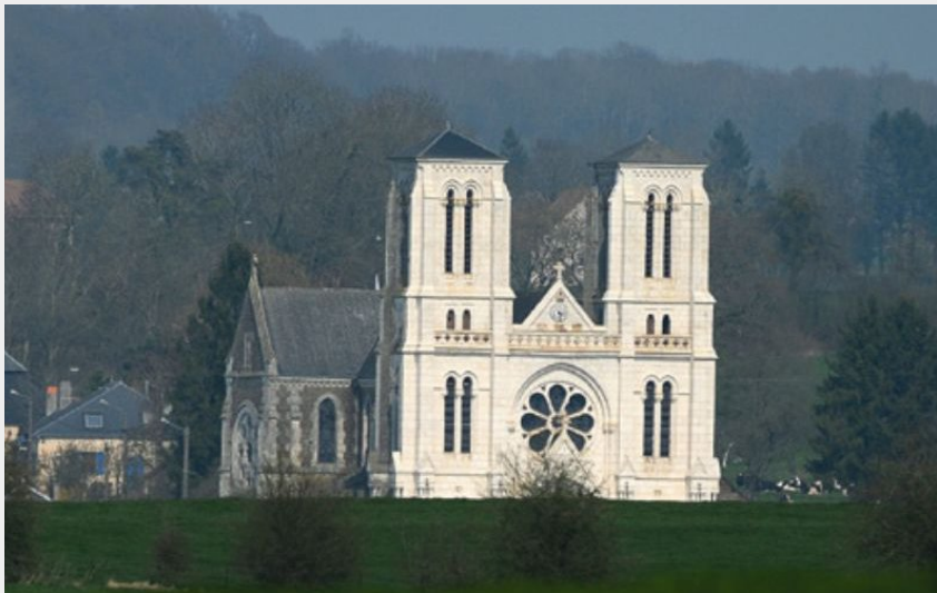
Église de Notre Dame de Bon Secours, réplique de Notre Dame de Paris.