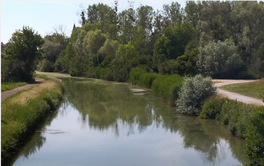
Canal des Ardennes