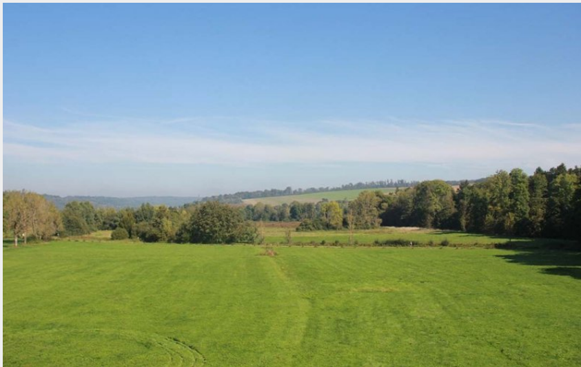
Vue aérienne de Poix-Terron