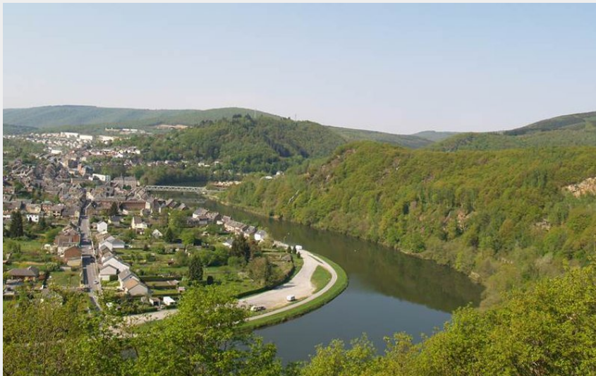
Point de vue de la Platale (Val d'Ardenne Tourisme)