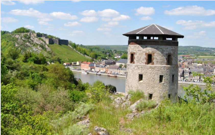
Givet depuis le Mont d'Hours