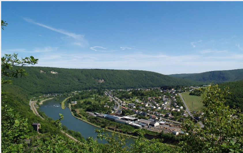
Vue sur Haybes et Fumay (Val d'Ardenne Tourisme)