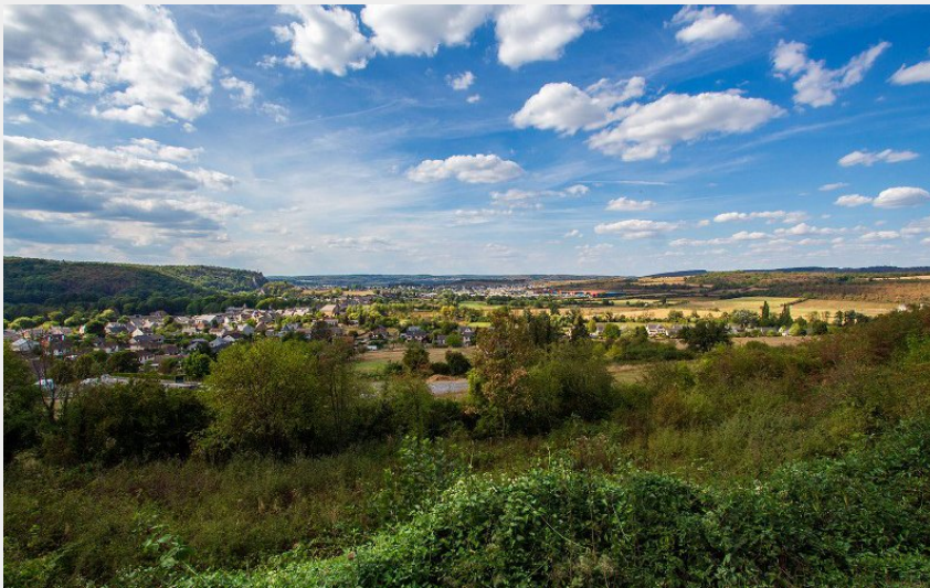
Paysage de la Famenne (Val d'Ardenne Tourisme)