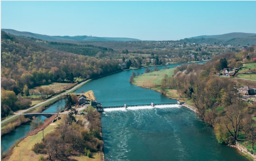
La Roche à Fépin (Les Droners)