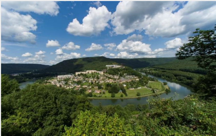
Panorama - Revin (D Truillard)