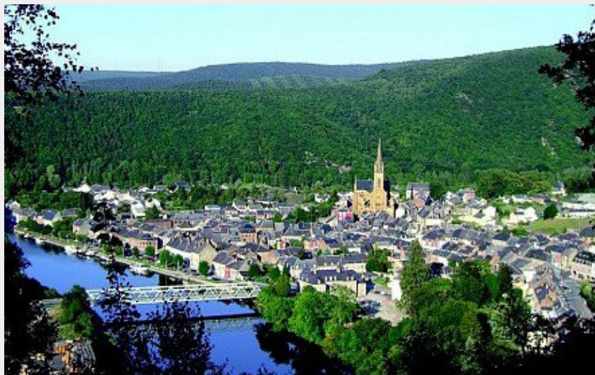
Vue sur la ville de Fumay