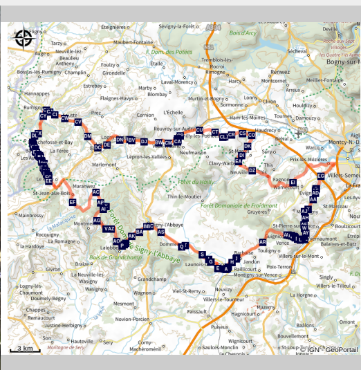
Signy L'Abbaye 02 (ADT des Ardennes)

Découvrez la Thiérache et ses patrimoines au gré de ce long-circuit.