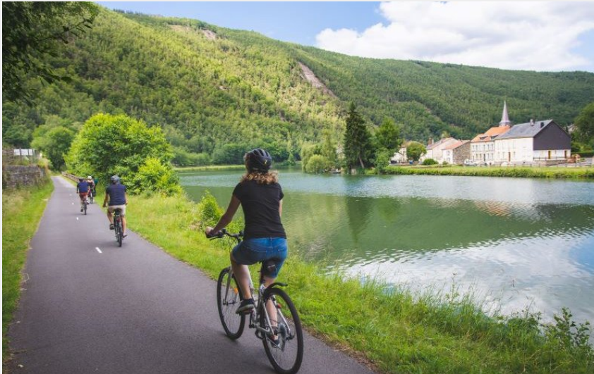
la meuse a velo montherme (pierre defontaine artge)