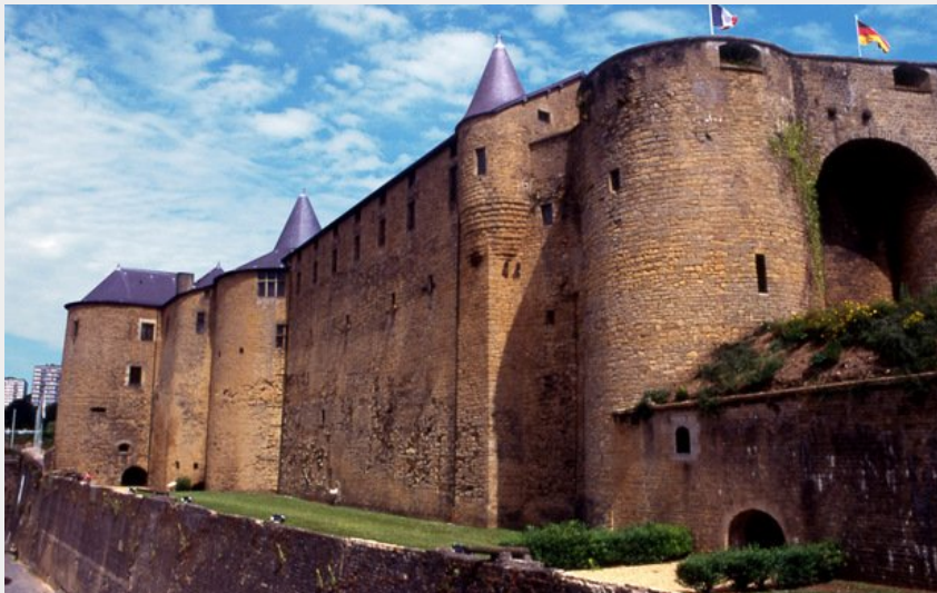
Sedan - Château fort